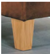
Alternativ-Fuß F221 Buche massiv