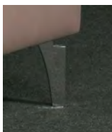
Standard-Fuß F840 Chrom