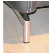
Alternativ-Fuß F225 Chrom