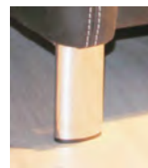
Alternativ-Fuß F128 Chrom